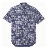
LA CHEMISE. En coton imprimé, Gitman Vintage, 200 €. www.gitmanvintage.com

Rasé ou avec d'épaisses dreadlocks, en pantalon de cuir moulant ou en chemise dévoilant ses deux tétons percés, le chanteur américain aime jouer avec son allure. A certains égarements stylistiques d'aujourd'hui, on préférera ses débuts en 1991, lorsqu'il reprend Give Peace a Chance avec Sean Lennon et Yoko Ono, et affiche une tenue sixties de rigueur avec lunettes rondes, veste en velours et (un seul) piercing. V. Ch. Stylisme F. Kh.