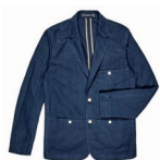
LE BLAZER. En jacquard, teint à l'indigo, Paul Smith, 301 €. www.paulsmith.fr